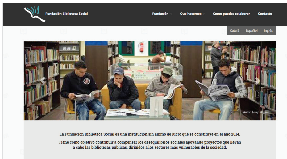
Fundación Biblioteca Social http://fundacionbibliotecasocial.org/es

biblioteca, sino para dar apoyo al equipo profesional, dotándoles de pautas y estrategias de actuación a la hora de afrontar estos proyectos y tratar con diferentes colectivos.